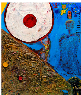
ציור 1 סזיפוס מגולל את הסלע הענק אל ראש ההר